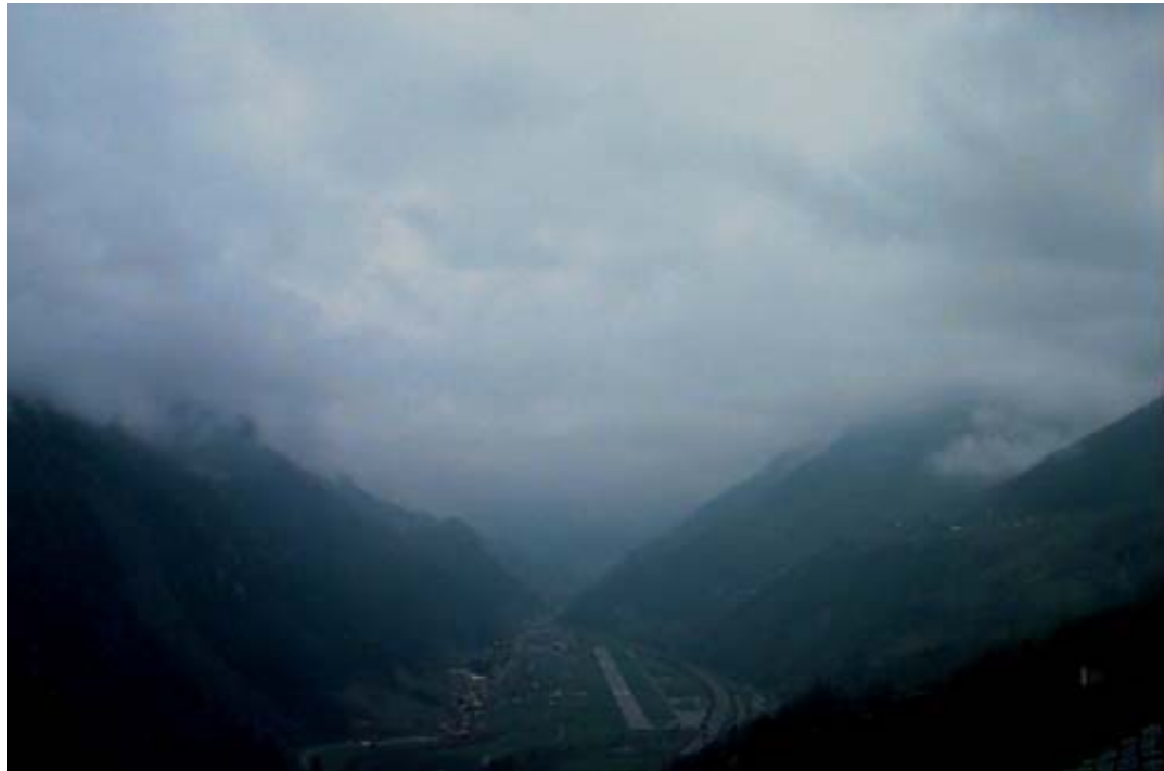
Abbildung 1 – Webcam-Bild: Aufnahme von Catto aus, Blickrichtung Piotta und Airolo am 14. April 2005 um 11:01 Uhr. Im Vordergrund ist der Flugplatz Ambri erkennbar.

Da die Bilder von Webcams meist nur für eine kurze Zeit gespeichert werden, konnte nach dem Unfall lediglich ein Bild eines Bereichs südlich der Unfallregion sichergestellt werden. Dieses zeigt die Wetterverhältnisse in der oberen Leventina kurz vor der mutmasslichen Unfallzeit (vgl. Abbildung 1).