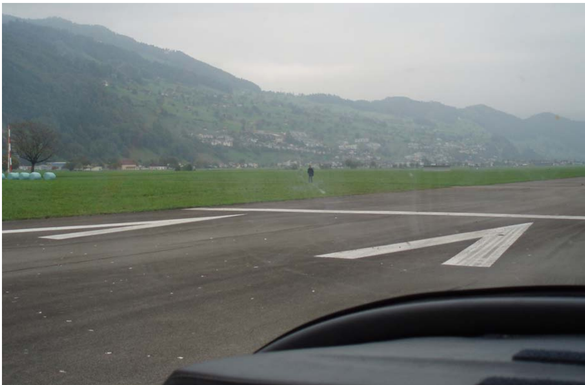
Sichtverhältnisse aus dem Cockpit unmittelbar nach dem Aufsetzen, Links die Barriere 9, in der Bildmitte eine Person auf dem Feldweg